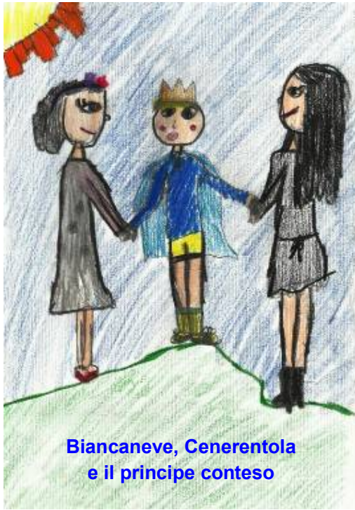
Biancaneve, Cenerentola e il principe conteso