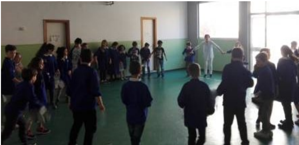
Invenzione coreografie di scena