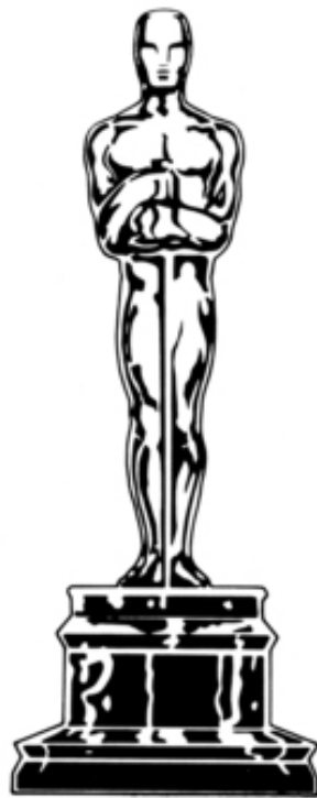
OSCAR © A.M.P.A.S. ®

“L’ALBERO DELLE FIABE” TEATRO DEL VIVAIO INCISA CLASSI QUARTE A.S.2015/2016 1 GIUGNO 2016