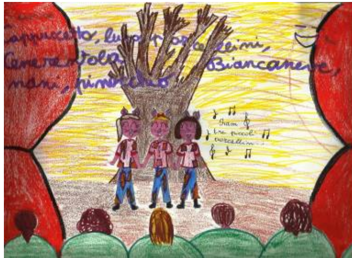
I TRE PORCELLINI